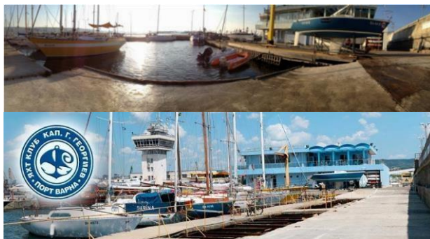
Facebook: Yacht Club Port Varna